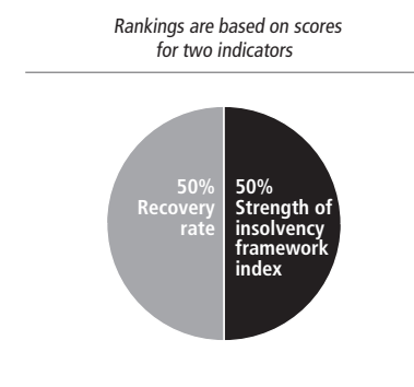
FIGURE 8.20 Resolving insolvency: recovery rate and strength of insolvency framework

Im Nachgang zu eingeleiteten Untersuchungen ergaben sich Unregelmässigkeiten (nachträgliche Einflussnahme auf die Bewertungen) in den Berichten 2018 und 2020. Diese beschlugen nicht die Bewertung der Insolvenzgesetzgebung, welche vorliegend von Interesse ist, so dass hier auf die ausgewiesenen Werte abgestellt wird. Als Folge dieser Unregelmässigkeiten hat die Weltbank Mitte September 2021 beschlossen, die Doing-Business-Berichte nicht weiterzuführen. 7